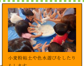
小麦粉粘土や色水遊びをしたりもします。