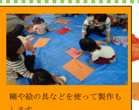
糊や絵の具などを使って製作もします。